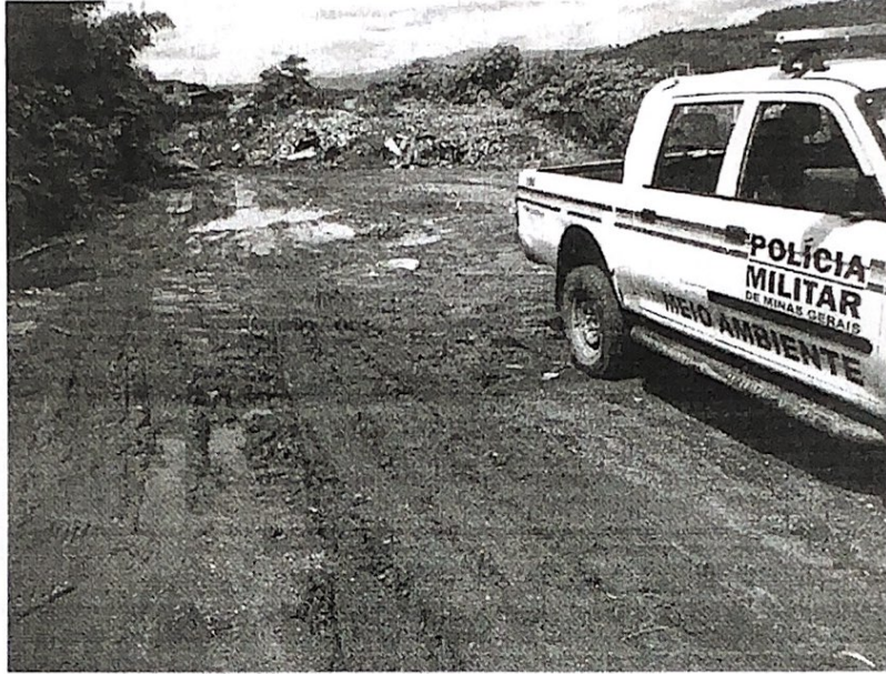
FOTO MEIO AMBIENTE 1